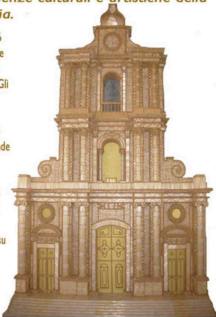
Chiesa di S. Giovanni, Monterosso Almo(RG) edizione 2009