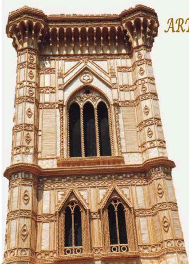
Campanile di Giotto, edizione 1996

Le "cattedrali di grano", espressioni uniche e altissime dell'arte dell'intreccio dei culmi di grano, quest'anno fanno rivivere, in forma originale e fortemente espressiva, i monumenti, le chiese e altre presenze culturali e artistiche della Sicilia.